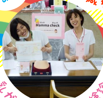
乳がんセミナー・検診